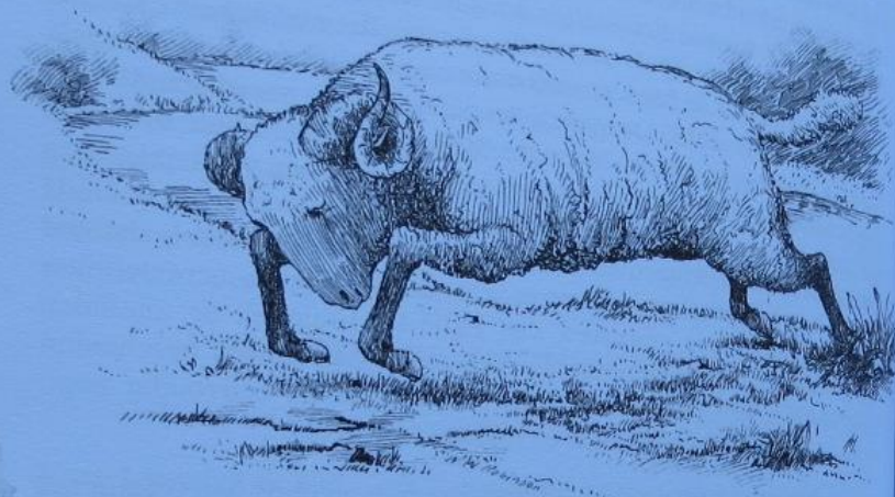
DE RAM - HET SYMBOOL VAN MEDO-PERZIË