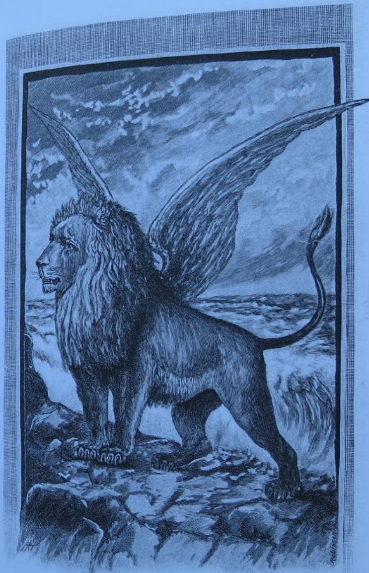
DE LEEUW - HET SYMBOOL VAN BABEL

Aanvankelijk had de leeuw arendsvleugelen, die duiden op de snelheid waarmee Babylon onder de leiding van Nebukadnezar overwinningen behaalde. In dit deel van het visioen zien wij dat een verandering heeft