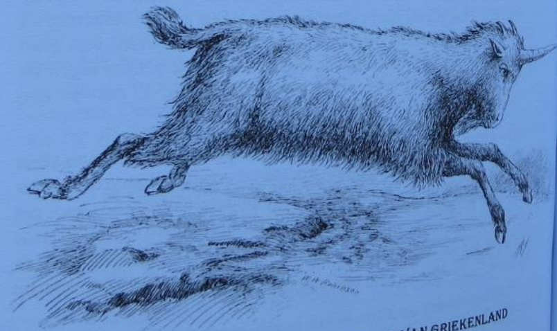
DE GEITENBOK - HET SYMBOOL VAN GRIEKENLAND

van Griekenland." Aangaande de toepassing van dit symbool op het Griekse of Macedonische volk, zegt bisschop Newton dat de Macedoniërs ongeveer tweehonderd jaar voor Daniëls tijd 'Ægeadae' ofwel het geitenvolk werden genoemd. De oorsprong van die naam verklaarde hij overeenkomstig heidense schrijvers als volgt: "Caranus, hun eerste koning, trok met een grote menigte Grieken uit om nieuwe woongebieden in Macedonië te zoeken. Door een orakel werd hem de raad gegeven, de geiten te volgen als gidsen naar zijn rijk. Toen hij later een kudde geiten zag wegvluchten voor een geweldige storm volgde hij hen tot Edessa en vestigde daar de zetel van zijn rijk. De geiten beeldde hij af op zijn standaard of vaandel, hij noemde de stad Ægea of geitenstad, en het volk Ægeadae of geitenvolk. De koningen van Macedonië werden gewoonlijk te Ægea begraven. Het is zeer opmerkelijk dat Alexanders zoon door zijn moeder Roxana 'Alexander Ægus', of 'zoon van de geit' werd genoemd, en sommige van Alexanders opvolgers zijn op hun muntstukken met geitenbokhorens afgebeeld" (Dissertation on the Prophecies, pag. 238).